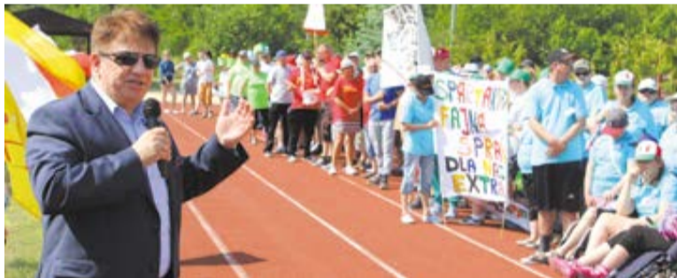
togo konkursu ofert na realizację zadań publicznych w 2019 roku. Brawa dla wszystkich zawodników! (red.)

A całość dofinansowano z budżetu powiatu ślubickiego, w ramach otwar-