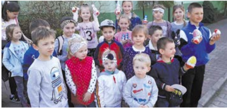
pin. Na zakończenie przyszedł czas na ognisko w Nowym Młynie, połączone z gramami i zabawami. Trzymamy kciuki za kolejne spotkania małych przyrodników! (red.)