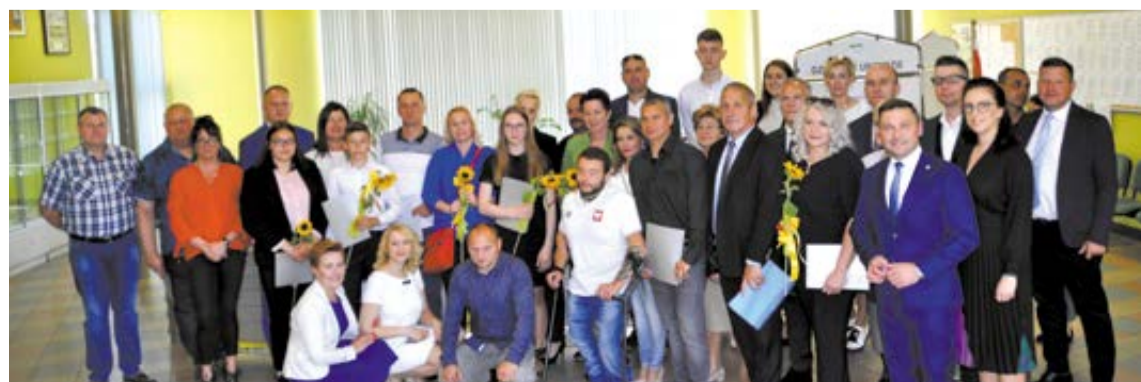
Stypendyści i zdobywcy nagród na pamiątkowym zdjęciu z rodzicami, radnymi i władzami gminy.

Tam, gdzie nie było pieniędzy na wylanie asfaltu (odcinki ulic: Diamentowej, Turkusowej i os. Słoneczne), na razie drogi utwardzono tłuczniem. W tym samym przetargu ujęto też przebudowę odcinków ulic Letniej i Wschodniej na osiedlu Zielone Wzgórze w Słubicach, Reja, Prostej i Drzymały oraz drogi prowadzącej do rancza w Drzecinie, a także drogi w Rybocicach. Z kolei mieszkańcy ulicy Piskiej w Słubicach mają, po lewej stronie jezdni, nowy, 300-metrowy chodnik. W ubiegłym roku gmina wybudowała chodnik po prawej stronie drogi, od skrzyżowania z Konstytucji 3 Maja do skrzyżowania Piskiej z ulicą Wojska Polskiego. (beb)