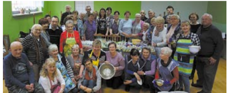
Projekt dofinansowany przez Powiat Ślubicki na realizację zadania publicznego "Wspieranie ochrony i promocji zdrowia tj. : "Organizacja i prowadzenie działań w zakresie ochrony i promocji zdrowia na terenie powiatu ślubickiego".