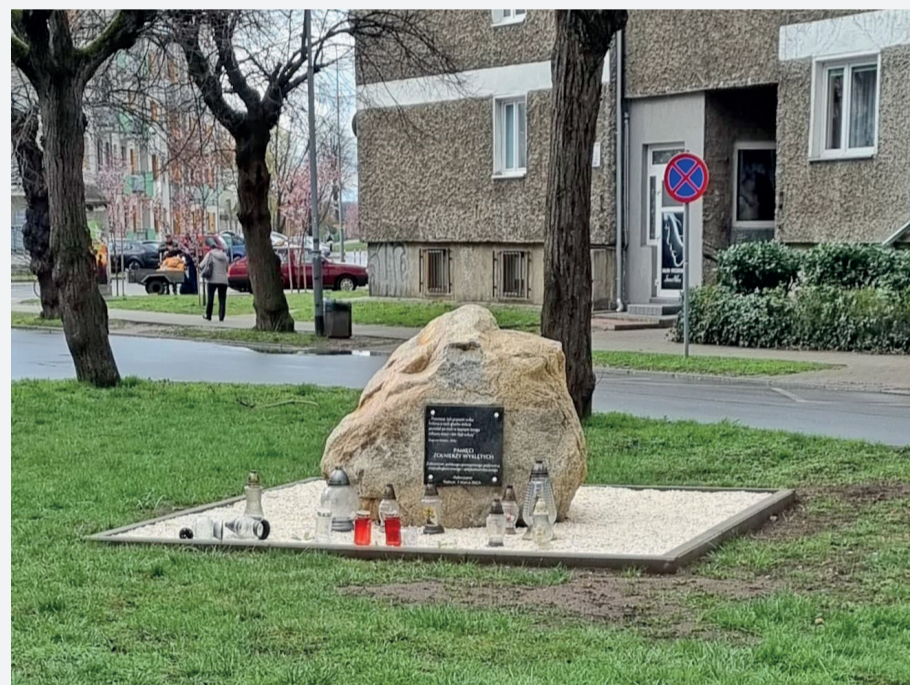
Z inicjatywy m.in. powiatowych radnych w Słubicach powstał plac Żołnierzy Wyklętych, który został oficjalnie otwarty 1 marca. Podczas uroczystości odsłonięto pamiątkową tablicę.